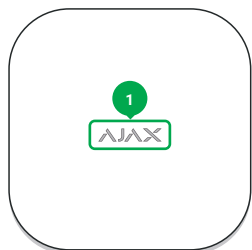
1 - Logo Ajax avec indicateur de lumière